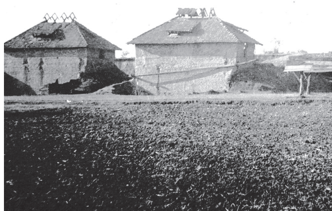
Bývalá cihelna na místě sportovního areálu

Vzhled obce se měnil i výstavbou nových rodinných domků, a přestavbou starých i výstavbou nových veřejných budov, jako byla škola a Kampelička. Na jejich místě bývaly malé zemědělské usedlosti, které obec vykoupila a zbourala. Mateřská škola stojí na bývalém poli. Sportovní areál stojí na místě bývalé cihelny.